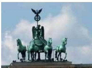
Quadriga - Brandenburger Tor

Berlin ist immer eine Reise wert. Verbringen Sie ein paar Sommertage in der Hauptstadt Deutschlands und entdecken Sie die Vielfalt die Berlin zu bieten hat. Besuchen Sie die historischen und modernen Bauwerke, flanieren Sie entlang der bekannten Shoppingmeile Ku'damm und relaxen Sie in einem der vielen Cafés. Für Ihre Kurzreise nach Berlin bieten wir Ihnen unser aktuelles „Summer in the City – Package“ an.