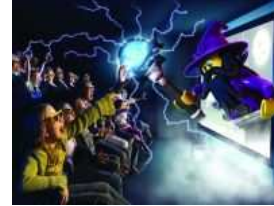
LEGOGLAND® Discovery Centre am Potsdamer Platz©