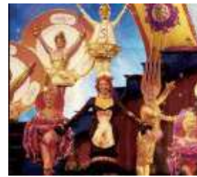
Disneys "Die Schöne und das Biest" im Theater am Potsdamer Platz