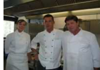
Küchenteam des Hollywood Media Hotels