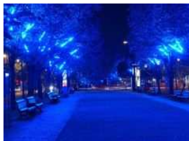
Unter den Linden